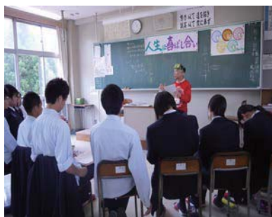
キャリアセミナー

全国各地のキャリア教育に関係する著名な専門家等からの指導・助言を頂きながら、県内はもちろんですが、全国的にもかなり充実したキャリア教育・進路指導を進めていくことで、職場定着もキーワードにしてきながら、企業等の進路先との連携を強化しております。