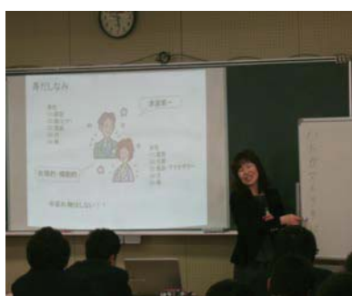
入社準備セミナー