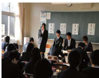
卒業生との懇談会