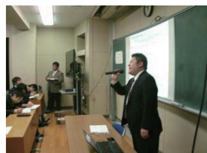
将来の家計・金融関係について