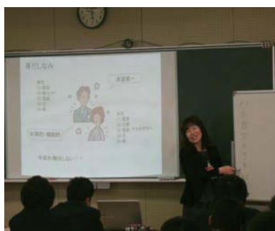
入社準備セミナー