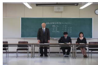
特定非営利活動法人ハーベスト ホームページ

今後は、生徒が記入したワークシートの分析等をきちんとしていく必要性があり、やりっぱなしにならないようにしていくことが、今後の本校キャリア教育の大きな課題としてある。